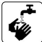
SPĂLARE FRECVENTĂ PE MĂINI CU APĂ ȘI SĂPUN